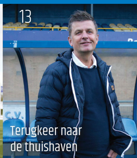
13 Terugkeer naar de thuishaven