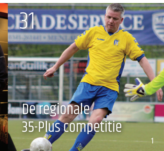
31 De regionale 35-Plus competitie

Kledingsponsors Spandoek sponsors Ballensponsors 37