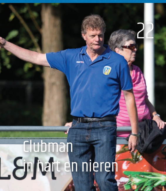
22 Clubman in hart en nieren