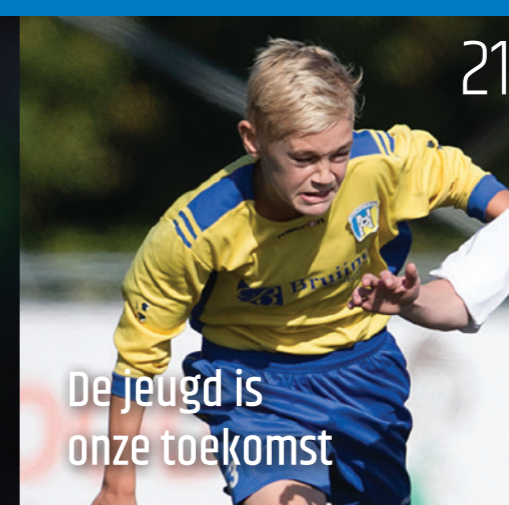
21 De jeugd is onze toekomst