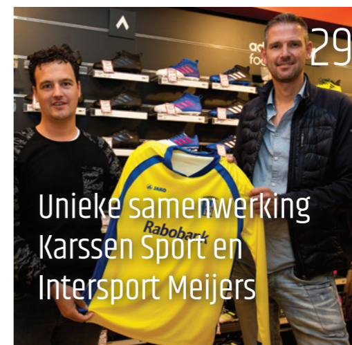
29 Unieke samenwerking Karssen Sport en Intersport Meijers

Unieke samenwerking Karssen Sport en Intersport Meijers 29