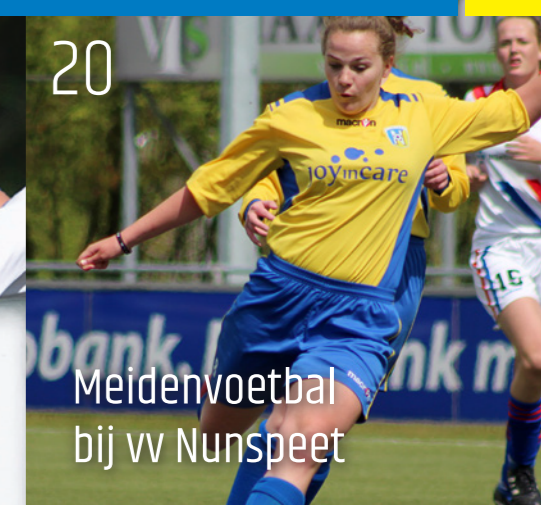
20 Meidenvoetbal bij vv Nunspeet