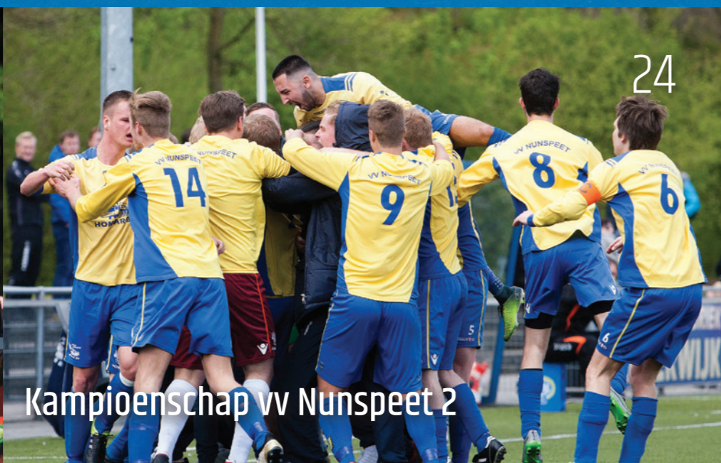
24 Kampioenschap vv Nunspeet 2